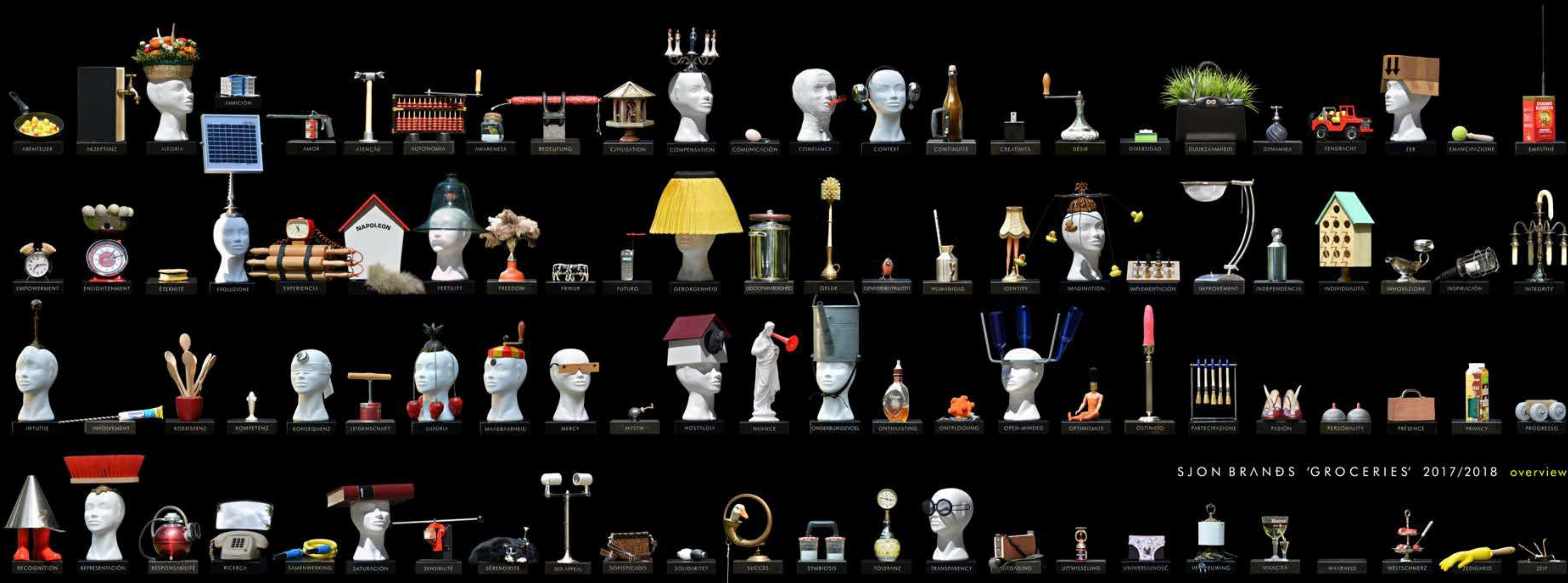
SJON BRANDS 'GROCERIES' 2017/2018 overview